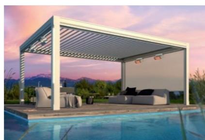
weinor Lamellendach Artares – Terrassenüberdachung der besonderen Art