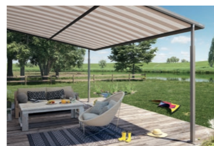
weinor Plaza Viva – die textile Pergola-Markise

Technische Änderungen sowie Sortiments-/Programmänderungen vorbehalten. Die Abbildungen können Sonderausstattungen zeigen, die nicht zum Standard-Lieferumfang gehören. Alle Texte und Abbildungen sind urheberrechtlich geschützt und Eigentum der jeweiligen Hersteller. Drucktechnisch bedingt sind Farbabweichungen möglich. Keine Haftung für Druckfehler.