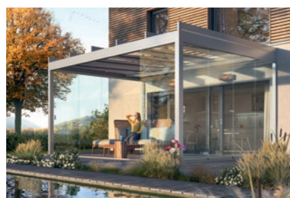
weinor Glasoase® – transparenter, lichtdurchfluteter Lebensraum