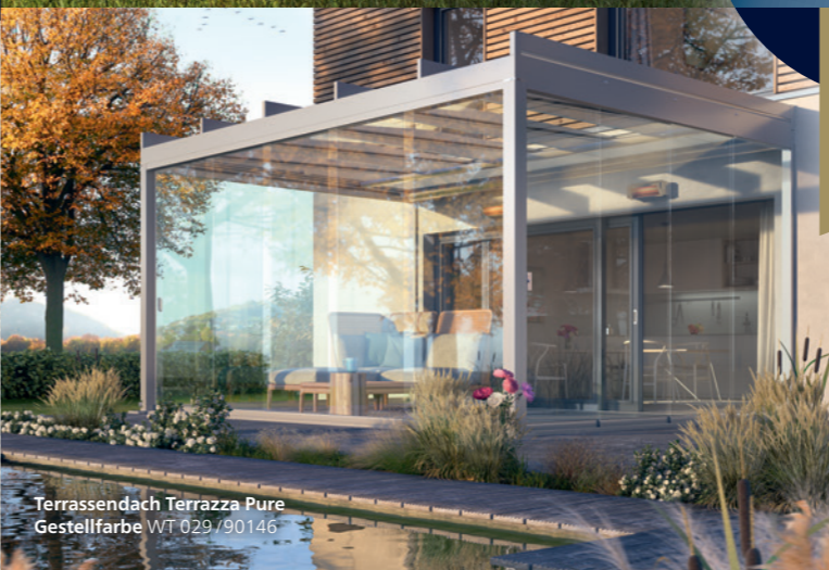
Terrassendach Terrazza Pure Gestellfarbe WT 029/90146

Vertrauen Sie auf das persönliche Engagement unserer erfahrenen weinor Top-Partner!